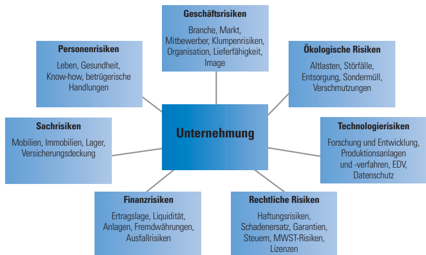
Mögliche Risikoarten im Unternehmen

Aus dem Gesetzestext geht nicht hervor, welche Risiken mit dieser Risikobeurteilung erfasst werden sollen. Dies stellt die Botschaft des Bundesrates zur Änderung des Obligationenrechts vom 23. Juni 2004 klar. Die Risikobeurteilung bezieht sich nur auf Risiken, die einen wesentlichen Einfluss auf die Beurteilung der Jahresrechnung haben können. Aus dieser Formulierung lässt sich ableiten, dass lediglich Risiken mit einem erheblichen Einfluss auf die Rentabilität oder die Finanzlage des Gesamtunternehmens zu beurteilen sind.