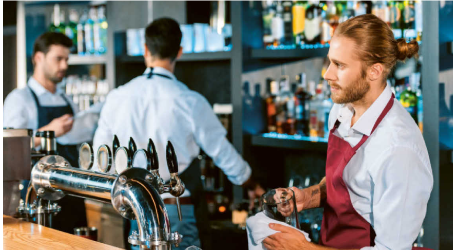
Der individuelle Anspruch auf bezahlte Feiertage hängt vom Anstellungsverhältnis ab.

Bei Teilzeitmitarbeitenden mit festen Arbeitstagen ist die Situation relativ einfach: Fällt ein Feiertag auf einen ihrer regulären Arbeitstage, haben sie frei und erhalten ihren normalen Lohn. Komplizierter wird es bei flexiblen Arbeitstagen. Hier empfiehlt sich eine anteilmässige Berechnung des Feiertagsanspruchs. Beispiel: Ein 50%-Mitarbeiter hätte bei 10 Feiertagen pro Jahr Anspruch auf 5 bezahlte Feiertage. Diese können dann flexibel zugeteilt oder als Zeitguthaben verrechnet werden.